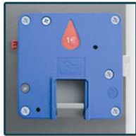
Cerradura con monedero.*