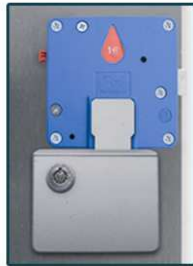
Cerradura con monedero y depósito.**