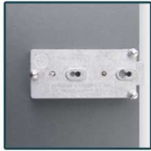
Cerradura Sargent & Greenleaf con llave de control.

Los compartimentos de seguridad Serie C100, están concebidos para la custodia de objetos de valor y armas en sectores como la banca, hostelería, seguridad privada y policías locales. Disponen de una cerradura Sargent & Greenleaf con llave de control y llave de cliente, ambas intercambiables (en caso de pérdida de llave, no es necesario cambiar la cerradura). Se presentan en 5 configuraciones de columnas y 4 tamaños distintos de compartimentos, pero con la posibilidad de fabricarlos a medida. Las columnas están preparadas para juntarlas y así poder formar un bloque compacto. También existe la posibilidad de suministrarlos dentro de un armario acorazado.