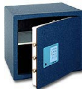
Confident Bloc 54