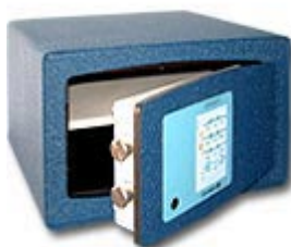
Confident Bloc 9