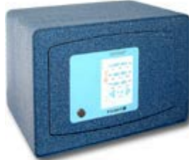
Confident Bloc 27