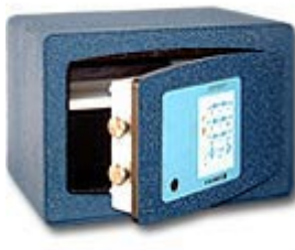
Confident Bloc 17