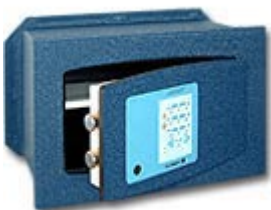
Confident EM 10