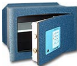
Confident EM 20